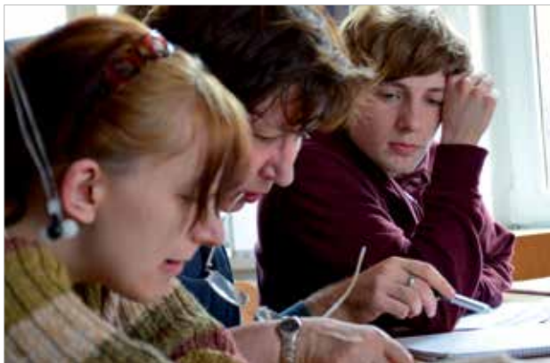
Entstehung der Gedenkwand (September 2012 - Juni 2013)