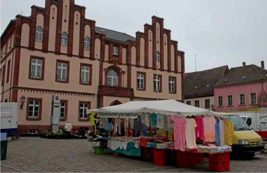
Rathausplatz Mügeln 2014

«Draußen standen noch weitere Personen. Ich schätze es waren 15-20 Personen. Die kamen auf uns zu. Zwei von denen sprühten ein Gas in unsere Richtung (...) Ich wurde geschubst und bekam einen Schlag gegen das linke Ohr (...) Ich bekam Schläge oder Tritte an den Kopf, meine Nase blutete, einen weiteren Schlag oder Tritt erhielt ich gegen mein linkes Auge. Auch wurde ich gegen meinen rechten Oberschenkel getreten oder geschlagen. Irgendwie konnte ich aufstehen und bin losgerannt. Ich bin dann ein paar von meinen Freunden hinterher gerannt. Ich habe mich nicht umgedreht. Ich habe nicht mitbekommen, ob ich verfolgt worden bin. Ich hatte Angst um mein Leben.» 41