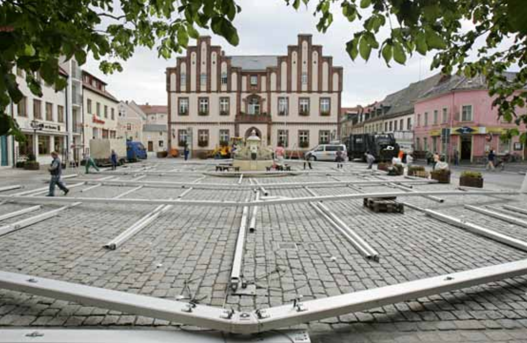
Bauarbeiter demontieren am Montag (20.08.2007) das Festzelt des Altstadtfestes auf dem Marktplatz von Mügeln.

Indern bewegten. 34 Sie zeigen schwarz bzw. dunkel gekleidete Jugendliche mit sehr kurzen Haaren; die Aufschrift eines Kapuzenpullis ist sichtbar: «Good night left side» – eine in der rechtsextremen Szene beliebte Drohung. Auf den Fotos sieht man auch, wie einige Jugendliche einen Arm heben bzw. strecken, womit sie möglicherweise den Hitlergruß andeuten. 35 Der Hitlergruß ist nicht ganz eindeutig erkennbar. 36 Dagegen zeigt ein Jugendlicher eindeutig den verbotenen und strafbaren «Kühnengruß»: Er streckt den rechten Arm und spreizt Daumen, Zeige- und Mittelfinger ab, die anderen Finger bleiben angewinkelt. So entsteht das typische «W» für «Widerstand». 37