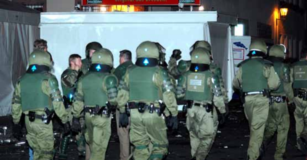
Polizisten in schwerer Ausrüstung am Sonntagmorgen (19.08.2007) in der Innenstadt von Mügelh.

Personen keinen Schutz gewähren (...) Plötzlich wurde durch eine Anzahl von gewaltbereiten Personen folgendes gerufen: ‚Deutschland den Deutschen, Ausländer raus.‘