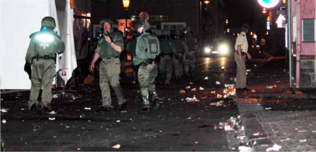
Innenstadt von Mügeln, 19. August 2007.

der Dokumentation «ausländerfeindlicher» Parolen, der Beschreibung eines allgemeinen «Hass' gegen Ausländer», der Aufnahme der Straftat «Volkshetze» und des massiven Polizeieinsatzes zur Zurückdrängung der Gewalttäter in der Tatnacht. 27 Die in den folgenden Tagen eingehenden Berichte und Vermerke der Polizisten, die am Einsatz beteiligt waren, bezeugen Neonazi-Parolen und beschreiben die Täter als «Rechte». 28 Eine Polizeimeisteranwärterin berichtet: