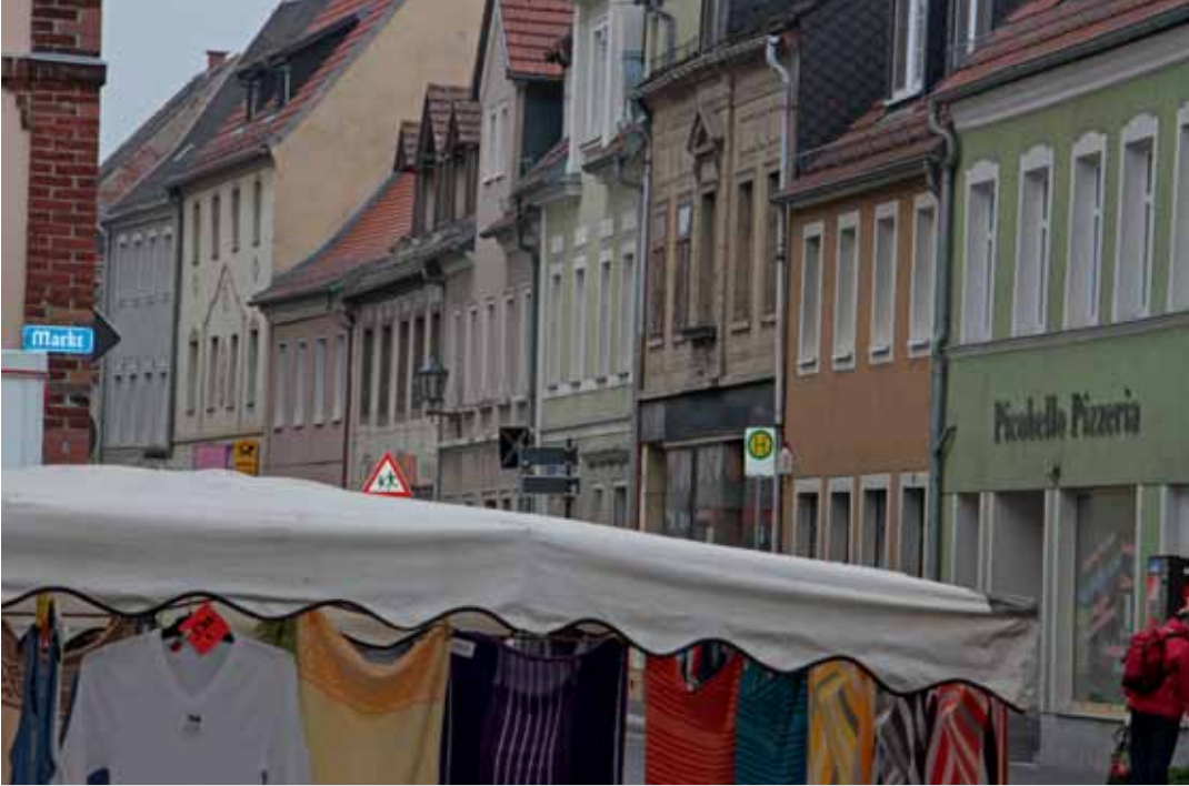
Pizzeria Piccobello Mügeln 2014 vom Rathausplatz gesehen

indischen Kollegen zum eigenen Schutz auf das Polizeirevier verbracht. 46