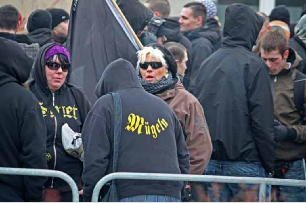
Rechter Aufmarsch am Dresdner Hauptbahnhof im Februar 2011