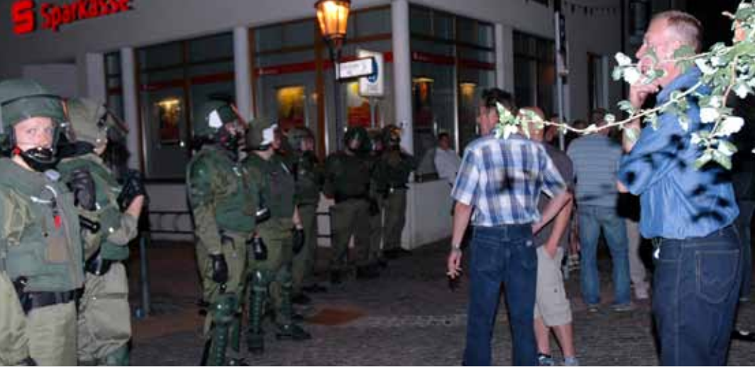
Polizisten in schwerer Ausrüstung stehen am Sonntagmorgen (19.08.2007) in der Innenstadt von Mügeln (Landkreis Torgau-Oschatz) Einwohnern der Kleinstadt gegenüber.

Situation und verdeutlichen, dass ein Großaufgebot der Polizei nötig war, um die Situation zu beruhigen: