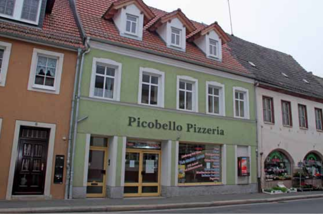
Pizzeria Picobello Mügeln 2014

werden. Außerhalb des Festzelts seien die Übergriffe brutal geworden: Jemand habe Gas gesprüht, er selbst sei auf das rechte Auge geschlagen worden und zu Boden gestürzt. Er habe aber wieder aufstehen können und sei zur Pizzeria gerannt, um sich vor weiteren Übergriffen zu schützen. Abschließend gibt er zu Protokoll: