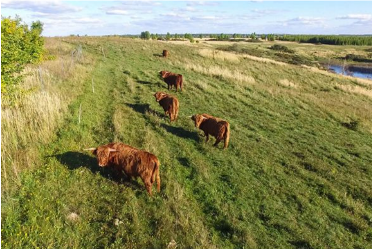
Highlands im NSG Werbeliner See