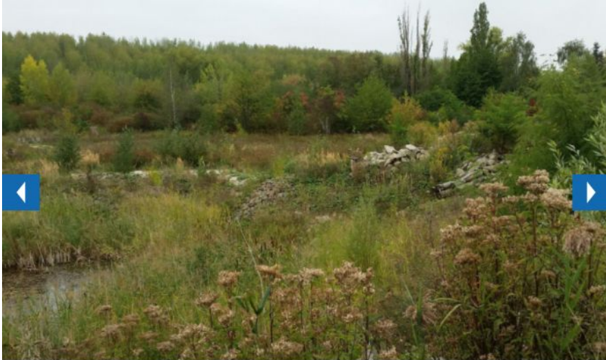
Das ehemalige Absetzbecken Maltitz ist heute ein Biotop.