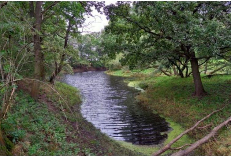
Der Altarm ist ein optimales Laichgewässer für Amphibien.