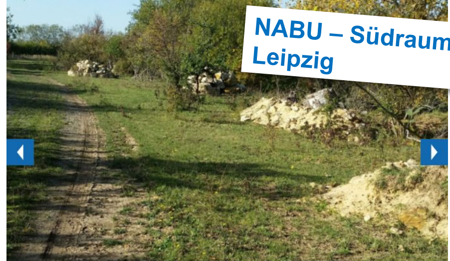
Im Biotop Aufschlussgraben Werben-Sittel wurden und werden Landschaftselemente zur Unterstützung von Amphibien gestaltet, d.h. kleine Gewässer angelegt, Stein- und Sandhaufen aufgeschichtet. Hinzu kommen Nistkästen und Benjeshecken für Vögel.